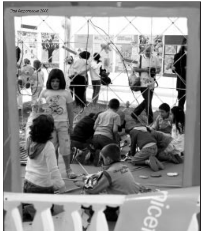
Città Responsabile 2006

Infatti il progetto, che da sempre la comunità porta avanti, è quello dell'impegno nel territorio di appartenenza; la filosofia è quella di far andare la comunità verso il territorio e non viceversa, partecipando attivamente ai tavoli di confronto in modo da essere un organo politico di partecipazione attiva. Sull'onda di questi pensieri a voce alta,