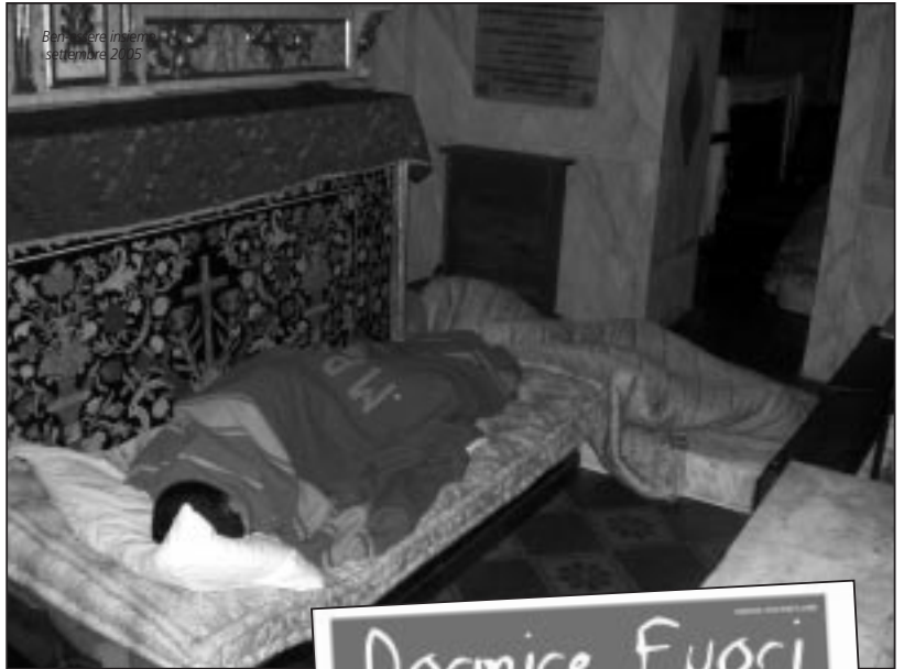
Barracche insediamento settembre 2005

Il Progetto Emergenza Casa è stato promosso dalla Rete Dormire Fuori, coordinamento di organizzazioni attive sui temi dell'accoglienza. La Rete è nata alla fine del 2004 per affrontare il problema di migranti ed italiani senza casa. La sinergia parte da un censimento dei senzatetto elaborato a fine 2003 da Comitato cittadino antirazzista e Gruppo diocesano Giustizia pace ambiente. Partecipano alla Rete anche le associazioni Muungano,