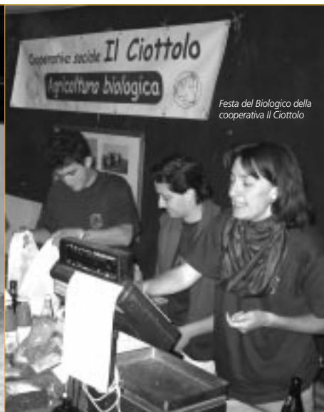
Festa del Biologico della cooperativa Il Ciottolo