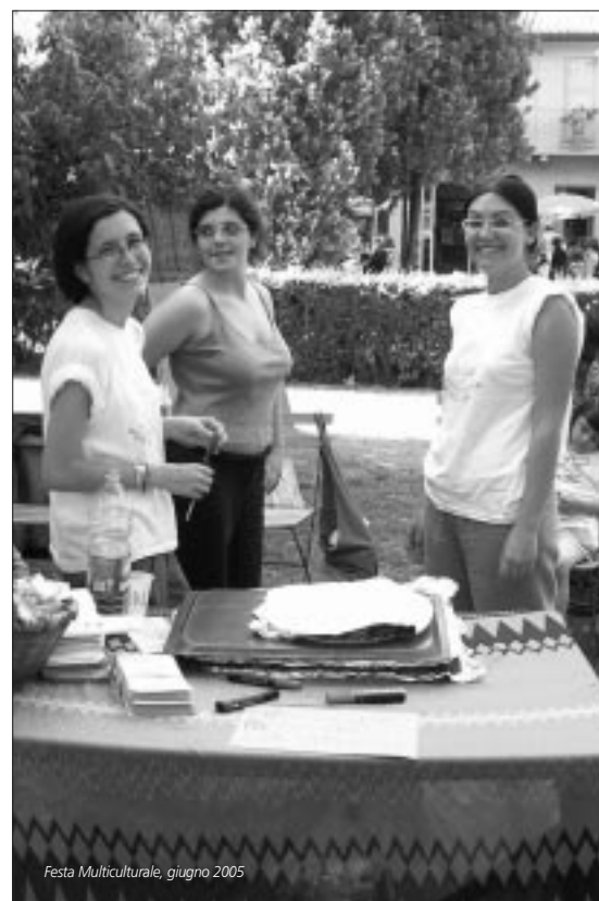
Festa Multiculturale, giugno 2005

Da osservare inoltre che per accedere alla deduzione, secondo