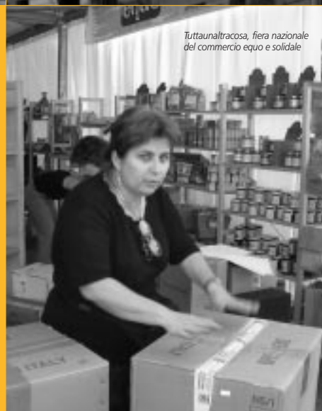
Tuttaunaltracosca, fiera nazionale del commercio equo e solidale