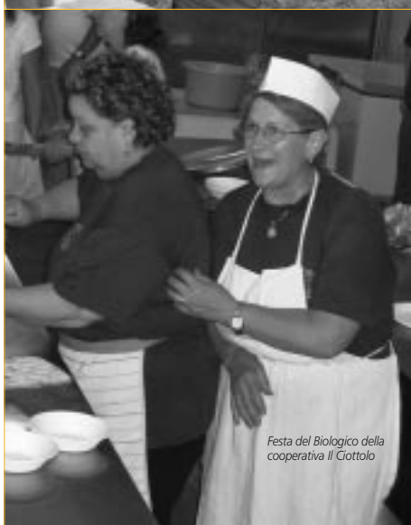
Festa del Biologico della cooperativa Il Ciottolo