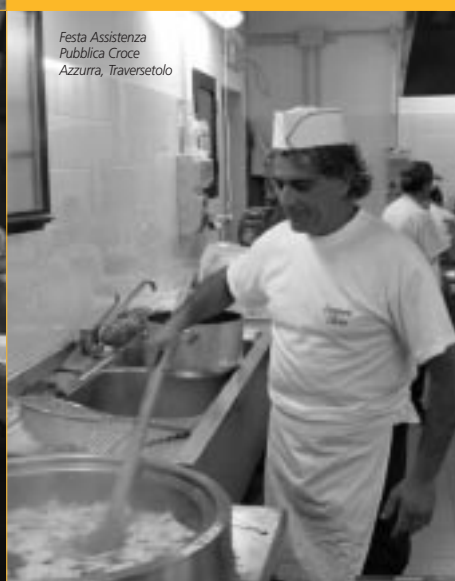
Festa Assistenza Pubblica Croce Azzurra, Traversetolo