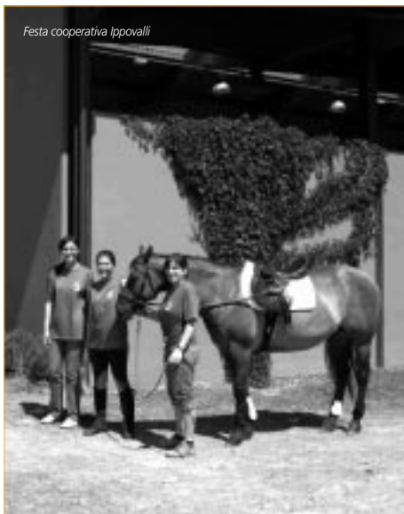
Festa cooperativa Ippovalli