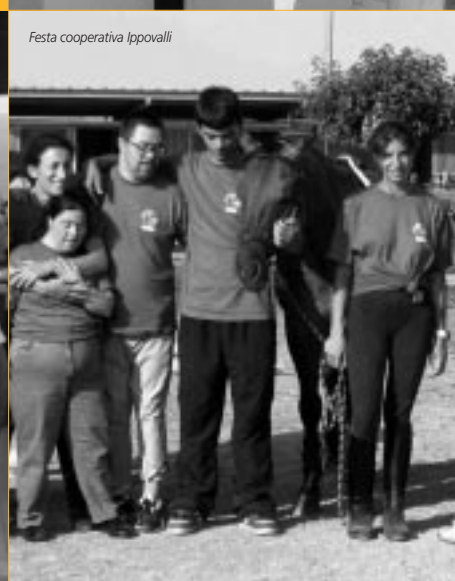
Festa cooperativa Ippovalli