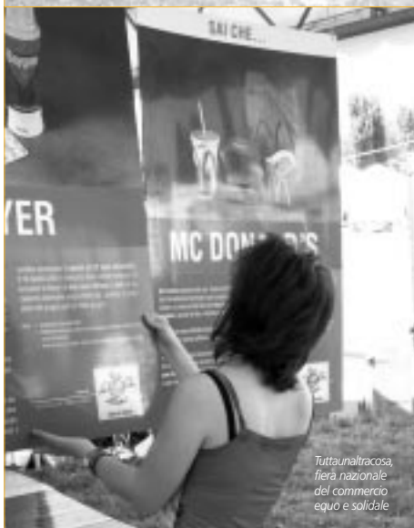
Tuttaunaltracosca, fiera nazionale del commercio equo e solidale

Nei mesi estivi l'attiva partecipazione delle associazioni di volontariato alla vita sociale e culturale della nostra comunità prende il sapore di carne alla griglia e i suoni di orchestre da ballo. Si perché anche attraverso l'organizzazione, faticosa ed onerosa, delle tante feste che animano i nostri quartieri e i nostri paesi, il volontariato contribuisce a rinsaldare legami e ad arricchire il tessuto sociale in cui operano. Le feste sono occasioni di serena convivialità e di positivo incontro tra le persone e spesso un mezzo attraverso cui sensibilizzare ai valori della solidarietà che reggono la convivenza civile: l'intercultura, il dono, il volontariato, il rispetto dell'ambiente. Tutto ciò è possibile solo grazie all'impegno volontario di tante persone che dedicano energie e tempo a tutto ciò che occorre fare per rendere possibile una festa. Così c'è chi passa ore alla SIAE per sbrigare le pratiche degli spettacoli, c'è chi suda sotto il sole per disporre tavoli e sedie, c'è chi soffre il caldo davanti ai fornelli per preparare tortelli e salami. Tutti hanno un compito preciso e ciascuno contribuisce alla buona riuscita di tutta la festa. Ci si stanca, è vero, ma ci si diverte in compagnia e poi si porta casa la soddisfazione di aver contribuito, almeno un poco, a migliorare la società in cui viviamo.