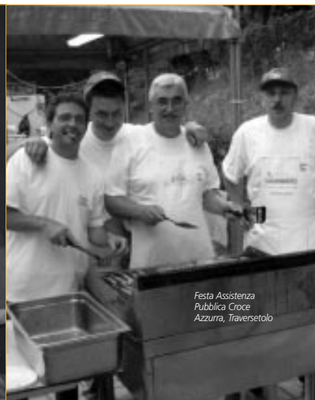
Festa Assistenza Pubblica Croce Azzurra, Traversetolo