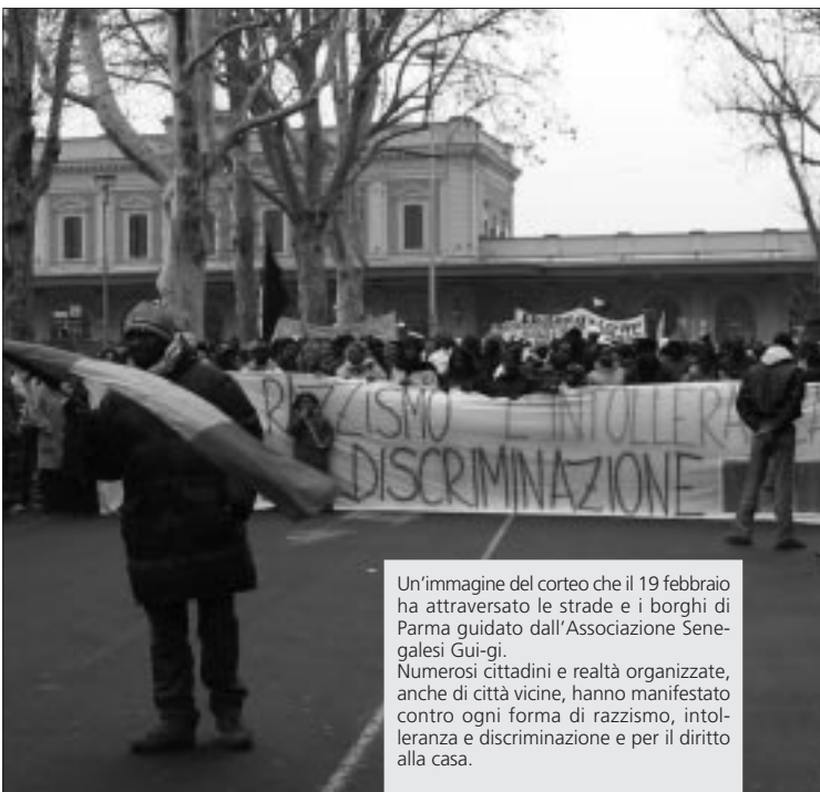
Un'immagine del corteo che il 19 febbraio ha attraversato le strade e i borghi di Parma guidato dall'Associazione Senegalesi Guj-gij. Numerosi cittadini e realtà organizzate, anche di città vicine, hanno manifestato contro ogni forma di razzismo, intolleranza e discriminazione e per il diritto alla casa.